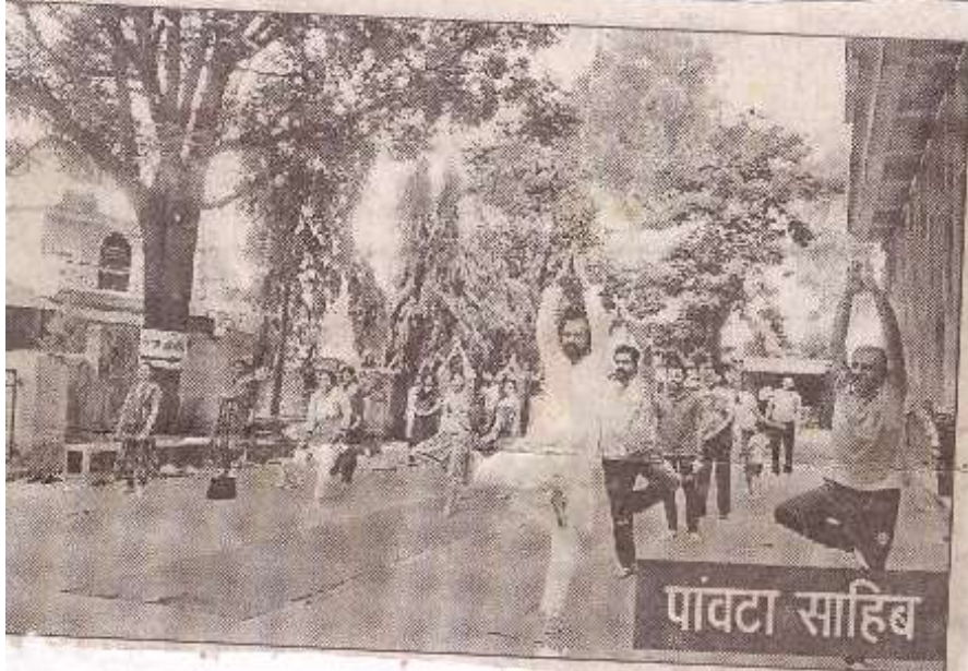
News Clip 13 Divya Himachal 21.06.2019 p,3